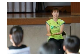
ふれあいフォーラム『奥原希望選手』