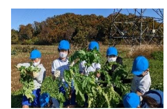
4年生 農園体験(ダイコン抜き)