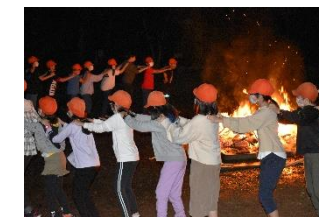
【10月】5年生 宿泊体験学習